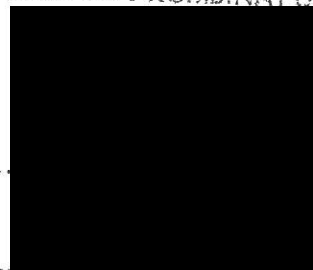
Palivový kombinát Ústí, s. p. (kupující)