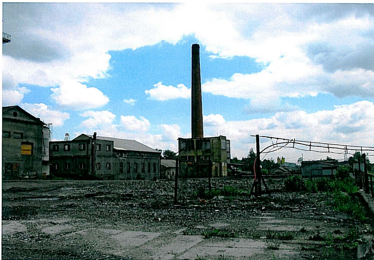
Plocha po demolici úpravny