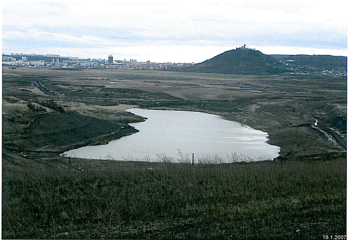
Jezero Most - 19. 1. 2007