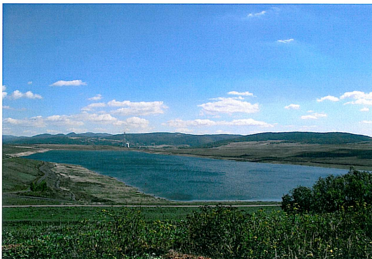
Jezero Chabařovice - 12. 8. 2006