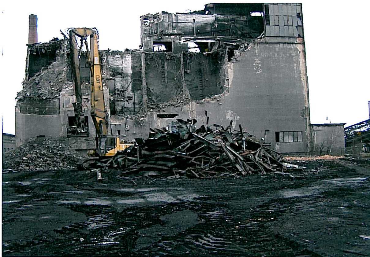
Průběh demoličních prací