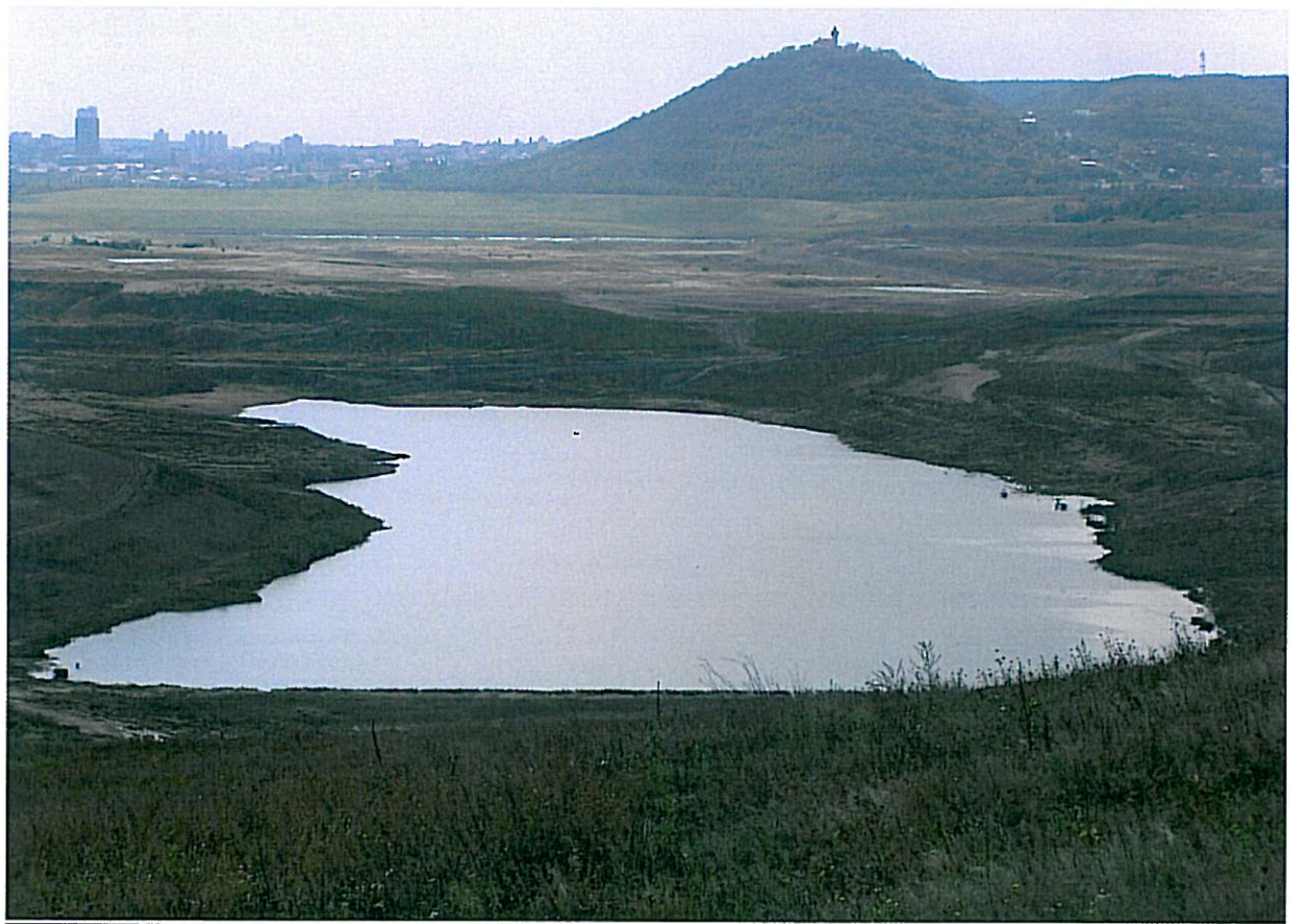
Jezero Most - 23. 10. 2007