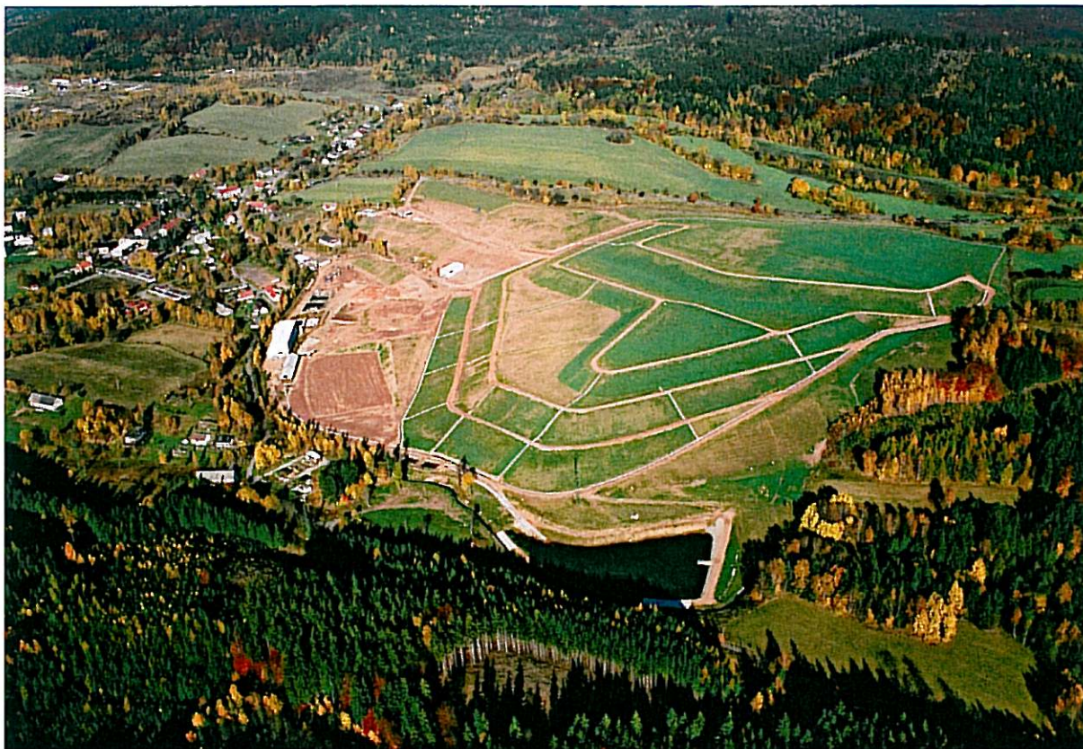
Hořící odval Kateřina – říjen 2005