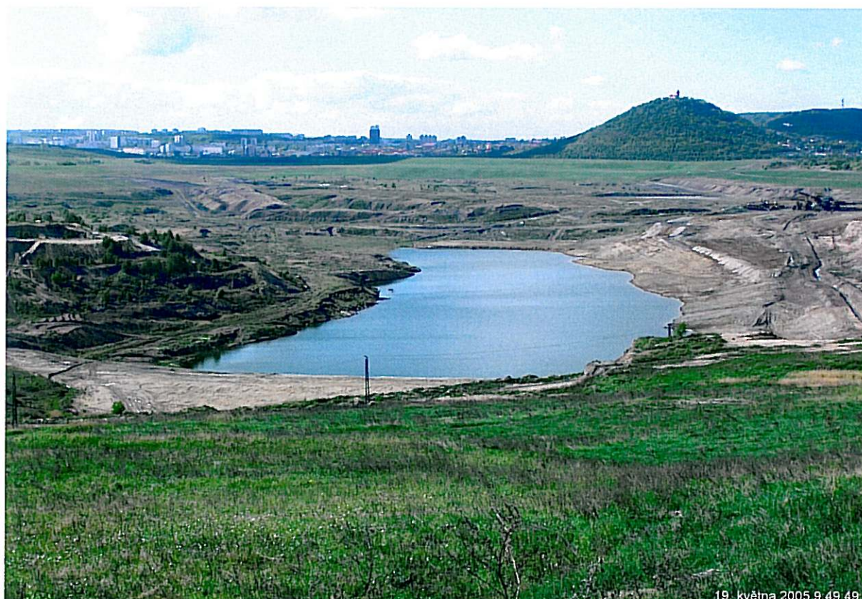
Jezero Most - 19. 5. 2005