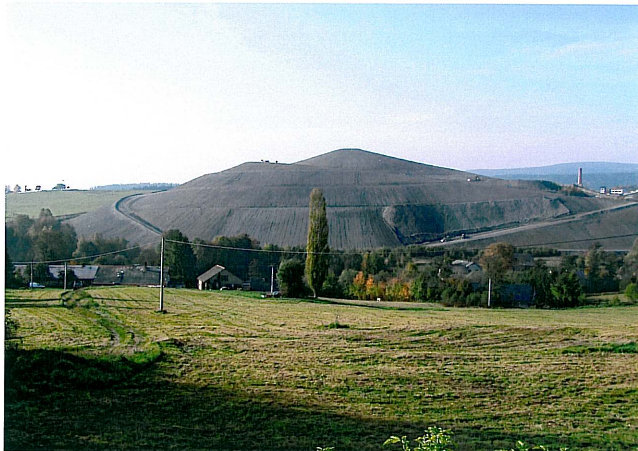
Důl Jan Šverma – následná péče