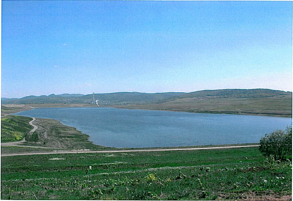
Jezero Chabařovice - 20. 4. 2007