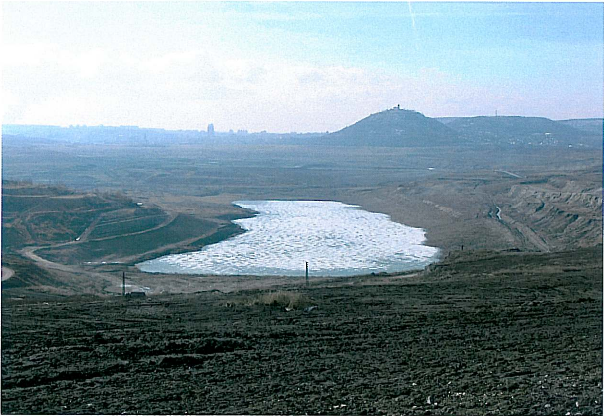
Jezero Most - 23. 3. 2006