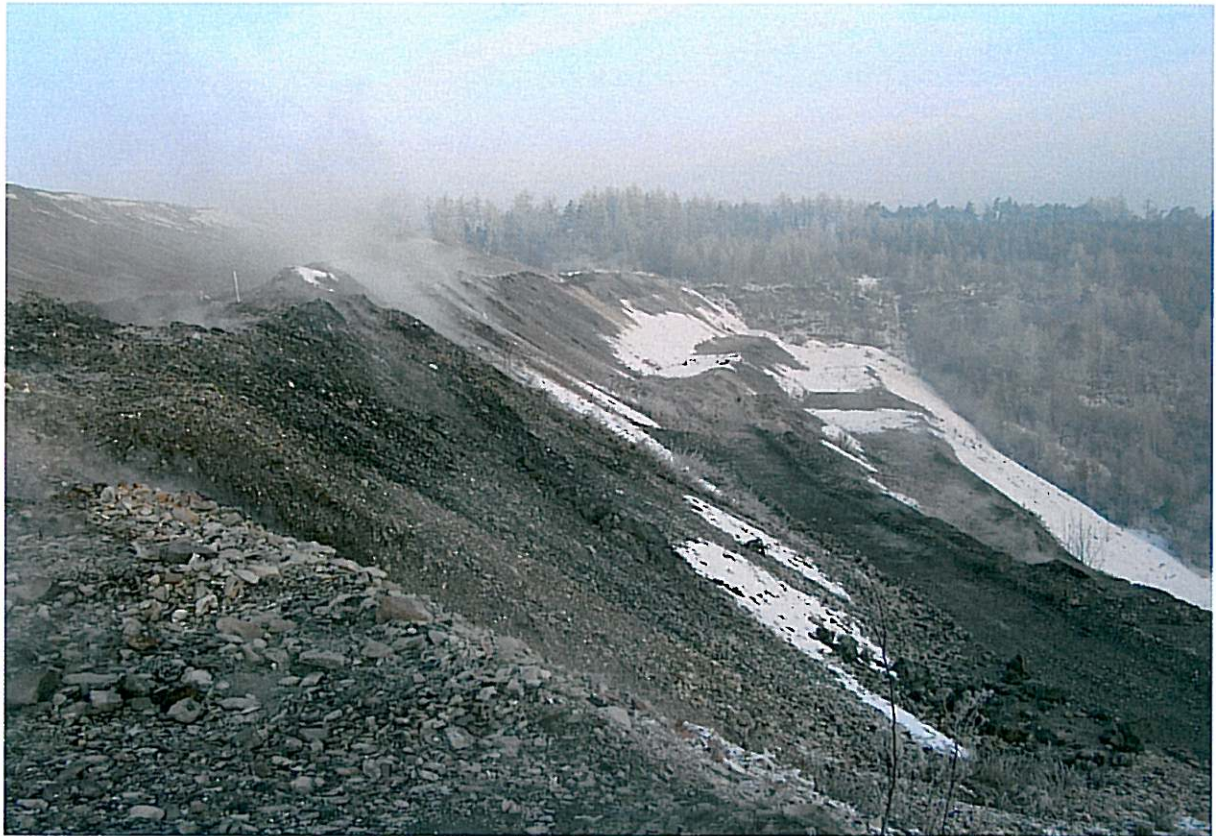
Odval V Němcích, vých. svah před započatím prací