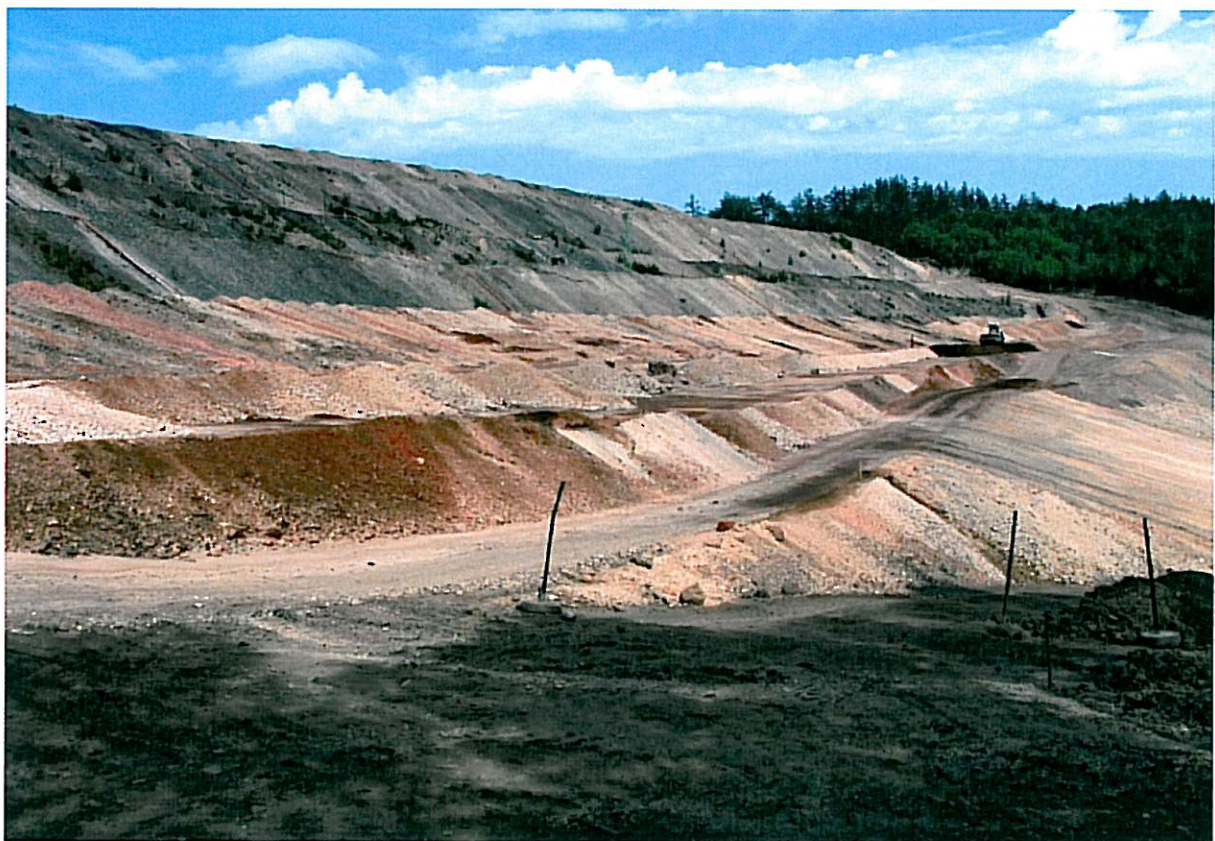
Odval V Němcích, návoz materiálu pro zajištění stability vých. svahů