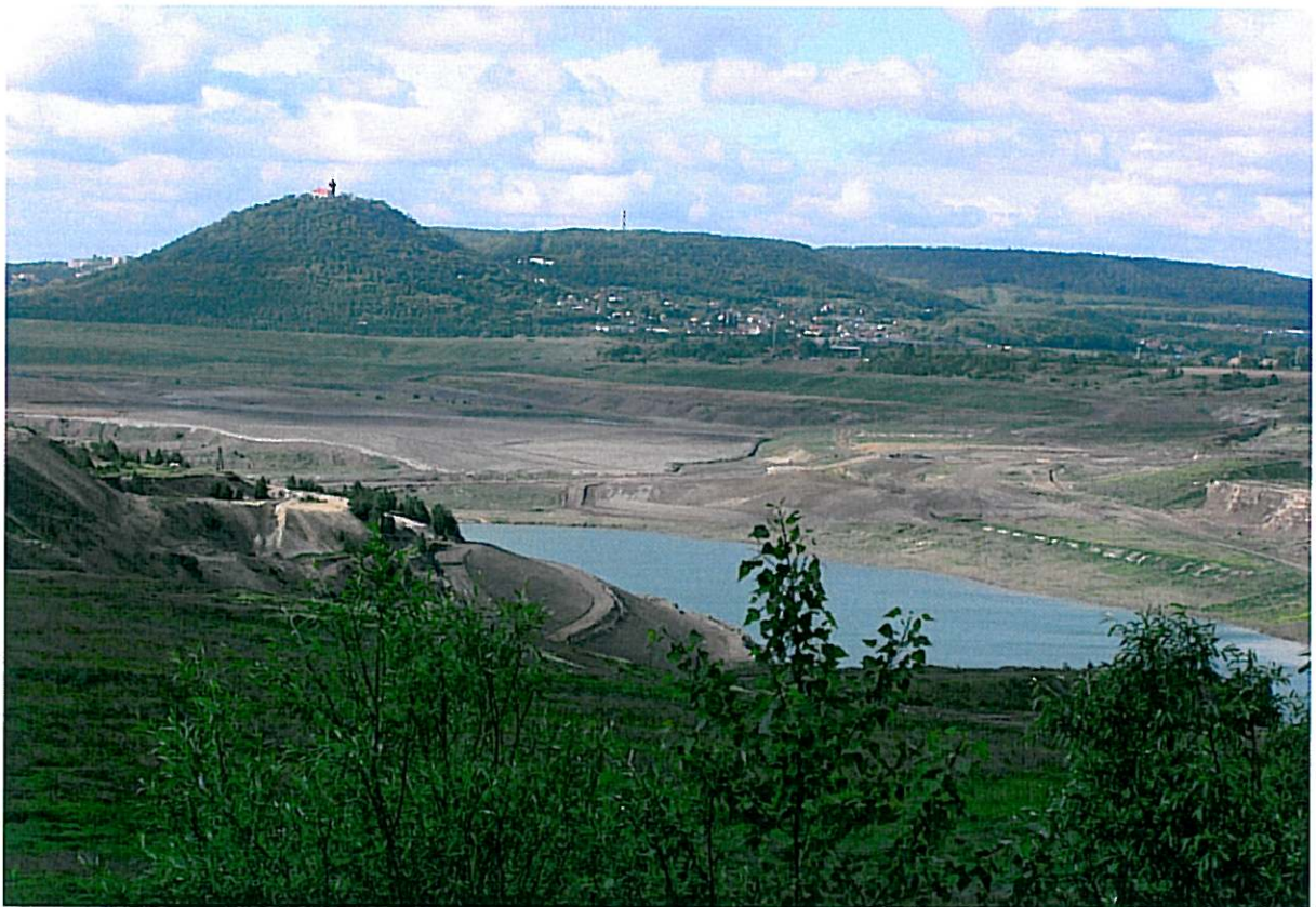
Jezero Most - 20. 8. 2006