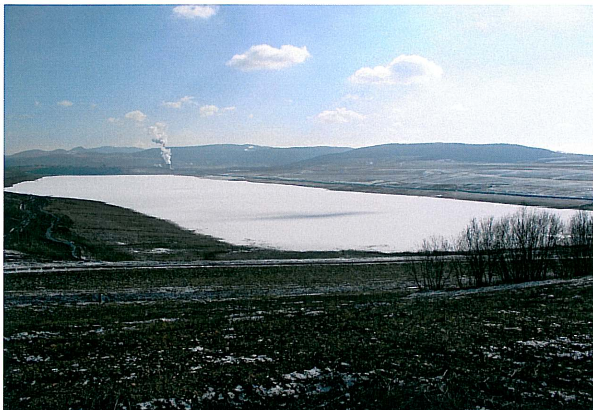
Jezero Chabařovice - 15. 2. 2006