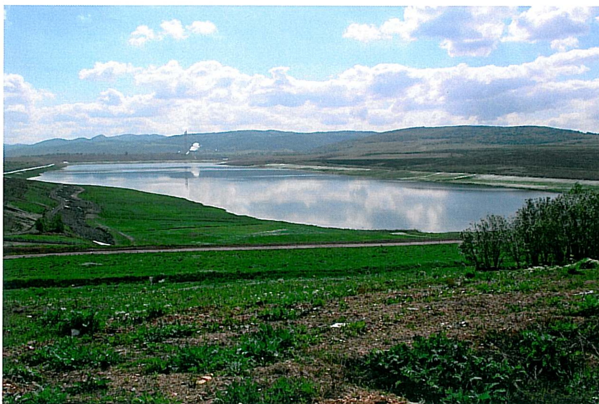
Jezero Chabařovice - 19. 5. 2005