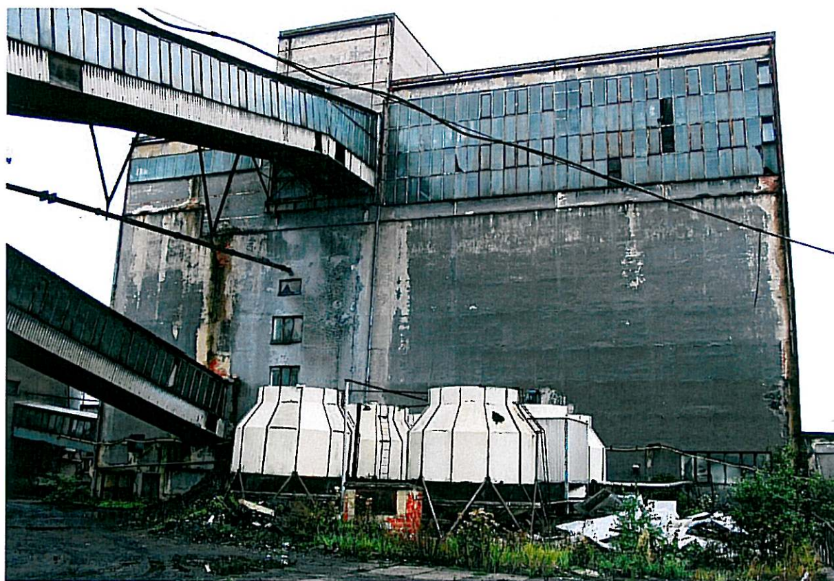
Objekt úpravny před demolicí