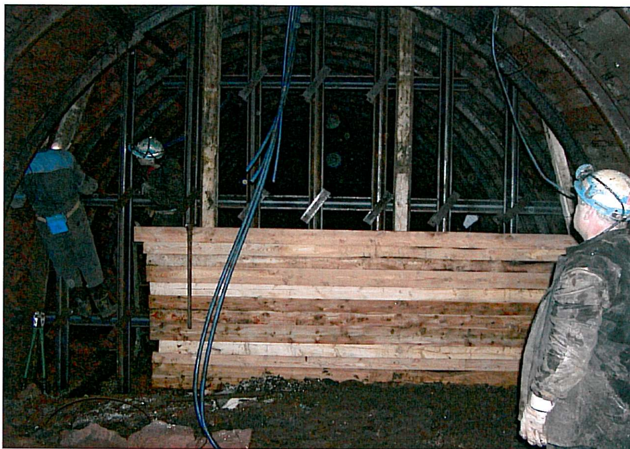
Petrovická úpadní – stavba opěrné zdi – září 2006