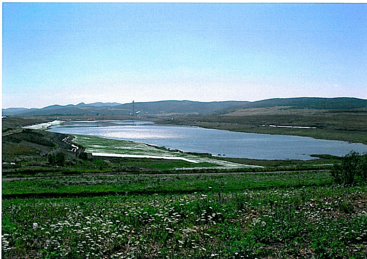
Jezero Chabařovice - 30. 7. 2004