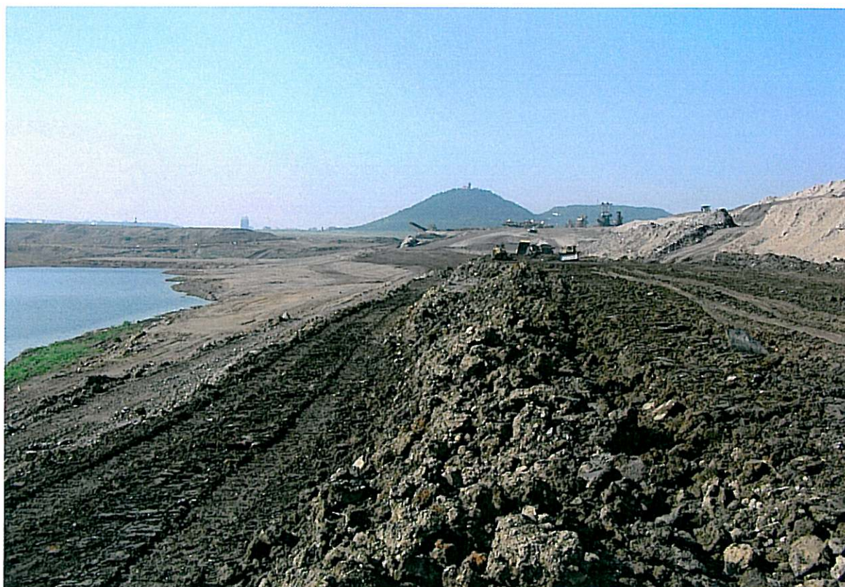
Jezero Most - 19. 7. 2004