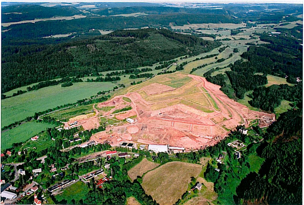
Hořící odval Kateřina – červen 2004