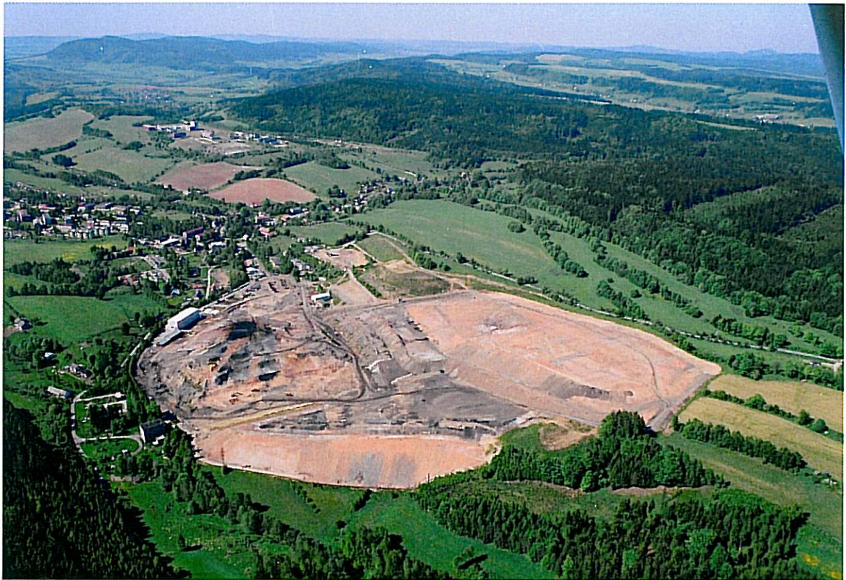
Hořící odval Kateřina – červenec 2001