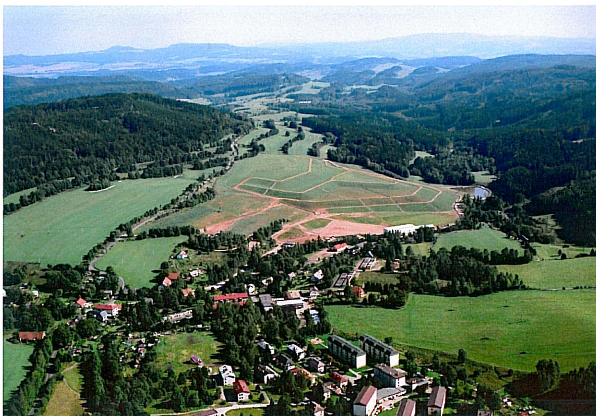
Hořící odval Kateřina – září 2006