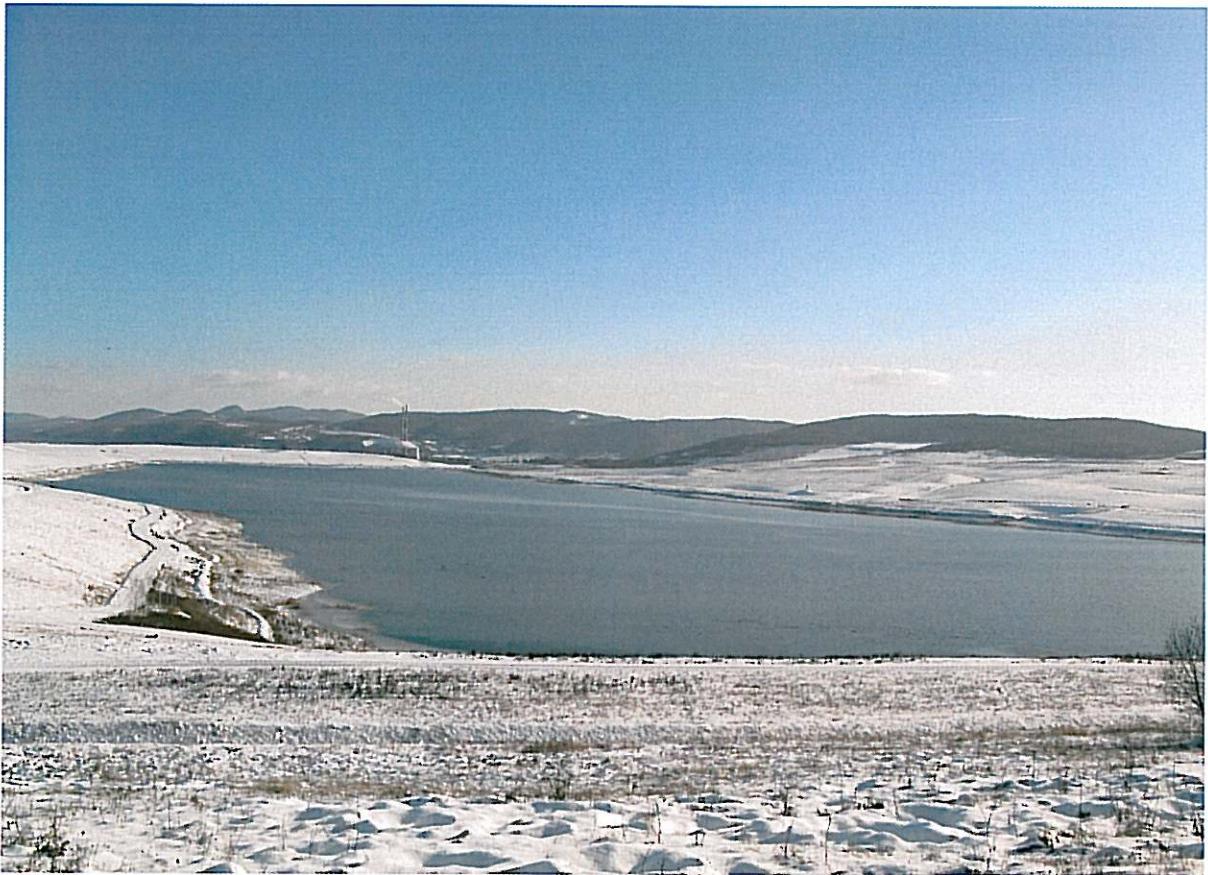
Jezero Chabařovice - 8. 1. 2008