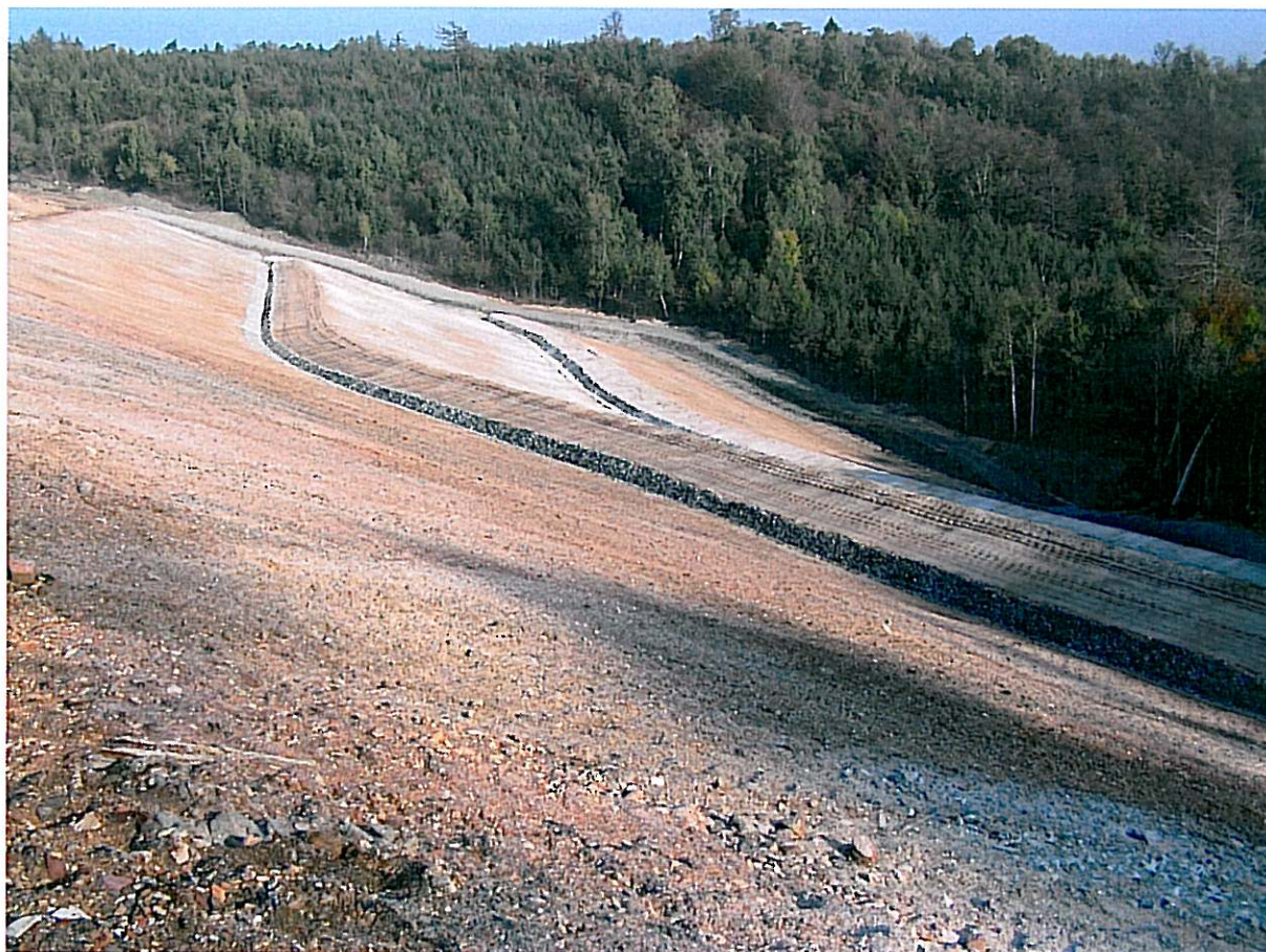
Odval V Němcích, vých. svah – po dokončení